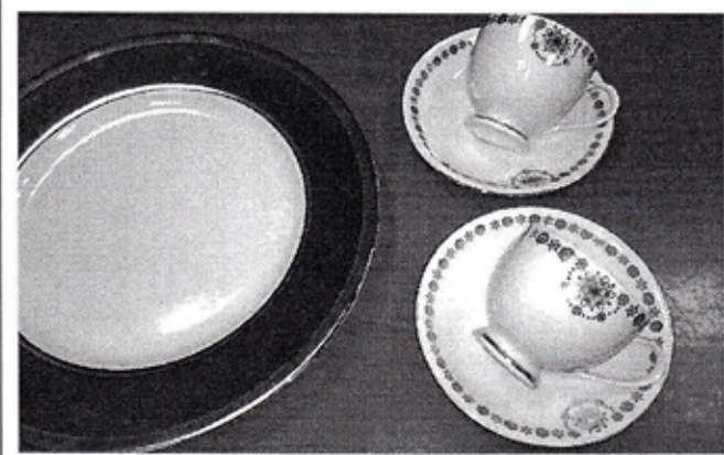
金と白金の転写技術「エバーゴールド」を採用した新商品